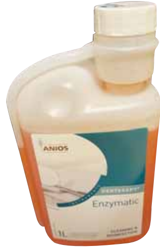
Ενζυμικά διαλύματα. Νέα γενιά καθαριστικών, φιλικά προς το χρήστη και το περιβάλλον.