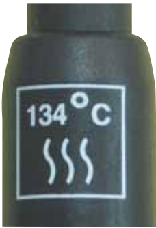
Απαραίτητη ένδειξη σε εργαλεία ενδοστοματικής χρήσης.