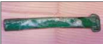
Προβλήματα από υπερέκθεση σε υψηλή θερμοκρασία.