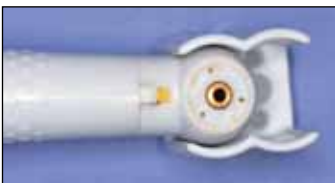
Λεπτομέρεια από χειρολαβή μιας χρήσης.