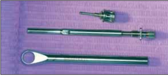
Εργαλεία εμφυτευμάτων που απαιτούν λεπτομερειακό καθαρισμό και αποστείρωση.