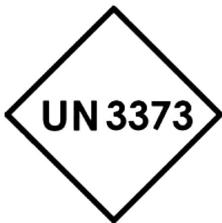
Σήμανση Διαγνωστικών Δειγμάτων