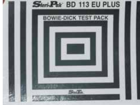
Επιτυχής καταγραφή κύκλου αποστείρωσης με βάση το δείκτη BOWIE-DICK (επιβάλλεται να διενεργείται τουλάχιστον μία φορά το μήνα)