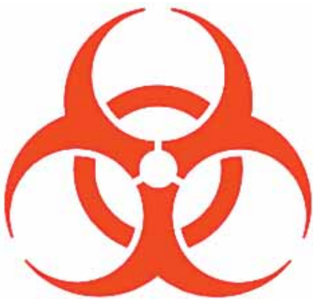
Σήμανση Βιολογικού Κινδύνου